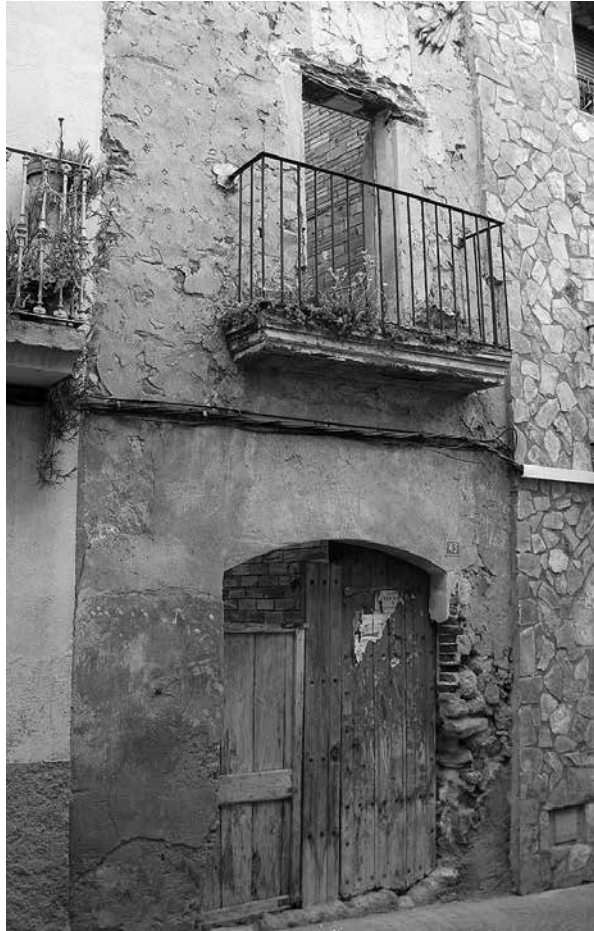
Cal Ramon «Perevinyes», Ulldemolins. La casa resta enrunada, fins avui, des dels bombar- deigs de 1938.

franquista sobre Ulldemolins i el seu terme. No esmenten, però, bombardeigs anteriors al 28 de desembre.