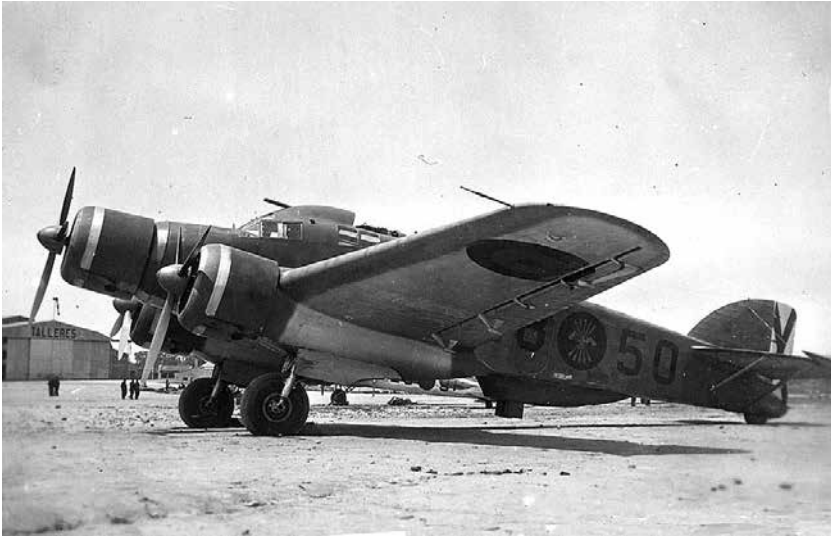
Savoia S-79, bombarder emprat per l'Aviació Legionària italiana i la Hispana de l'exèrcit franquista

a la costa, s'havia incrementat molt, fonamentalment per l'actuació continuada de l'Aviació Legionària italiana amb base a Mallorca. Però també, d'ençà la fi de la batalla de Terol, els avions franquistes, des de bases peninsulars, van començar a actuar amb més freqüència sobre Catalunya. A l'interior, la guerra es vivia amb una certa calma. Reus, tanmateix, era prou proper i les conseqüències dels bombardeigs, ben conegudes. Per a protegir la població dels atacs enemics, en un moment en què encara no existia el radar, calia disposar d'una xarxa d'escoltes i d'observatoris que, des de diferents indrets, pogués avisar del perill imminent. Es van crear punts de vigilància com el de Bellmunt del Priorat, vital, en aquest cas, per a controlar l'aproximació d'aparells enemics des de l'interior vers el Priorat i el Camp de Tarragona i poder avisar del perill imminent les poblacions, que activaven les alarmes.