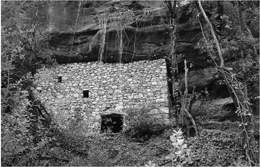
Coves i masos van servir de refugi a la població. A la fotografia, cova del Tuis, a la vall del riu Siurana

poble, perquè no semblés un mas robat, una colla d'avis valents: el iaio Victori, el iaio Catero, l'Alberto de cal Jaumó...». 62